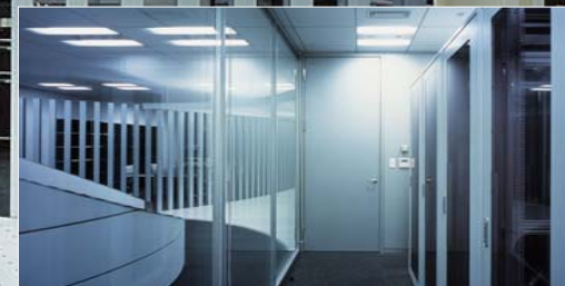
研究用超高速ネットワークJGN2にも直結