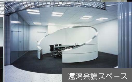
遠隔会議スペース