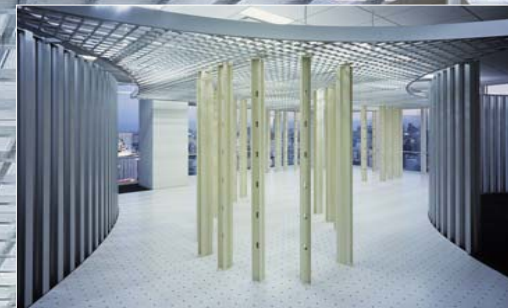
可動式コラムによる空間の自由なレイアウト